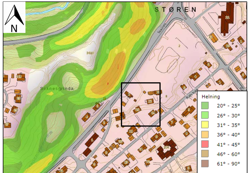
Figur 6-6: Bratthetskartet viser en maksimal helning på 36-40 grader (NGI). Planområdet er markert med svart firkant.

Det er ikke registrert tidligere skredhendelser i området ifølge www.skrednett.no .