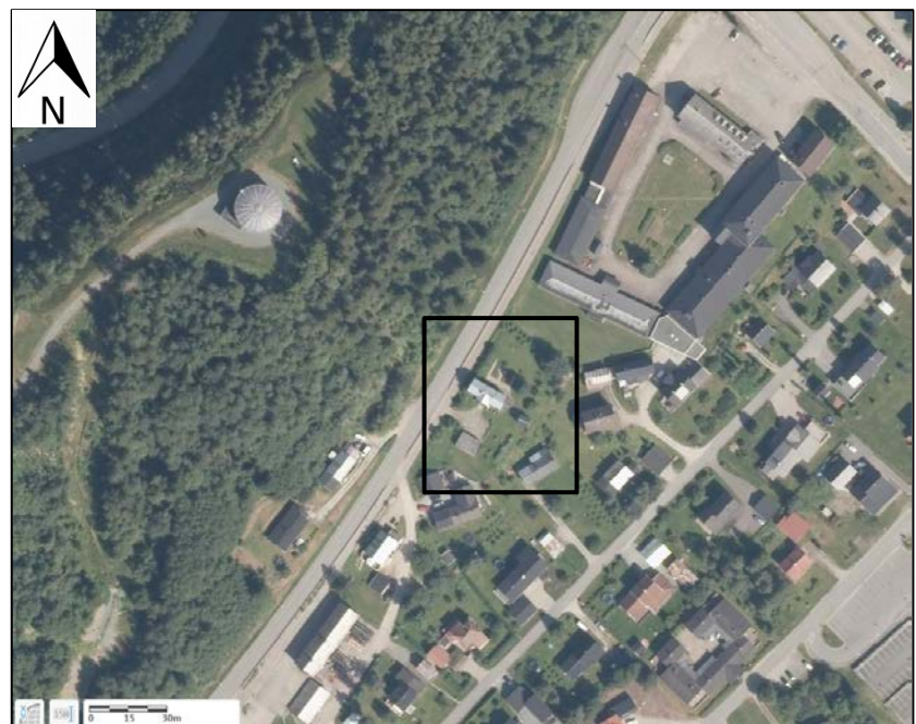
Figur6-5: Flyfoto indikerer tett vegetasjon i fjellsiden over planområdet.

Planområdet ligger ved foten av en ca. 46 meter høy fjellside, som på det bratteste har mellom 36-40 grader helning. Ut i fra flyfoto er fjellsiden tett vegetert med blandet, godt etablert skog. Basert på flyfoto er det ikke mulig å observere blottet berg eller vannveier i området. Den tette vegetasjonen reduserer sannsynligheten for at det dannes glidesjikt i snømassene. Snø vil samles opp på greiner og deretter falle ned som klumper eller