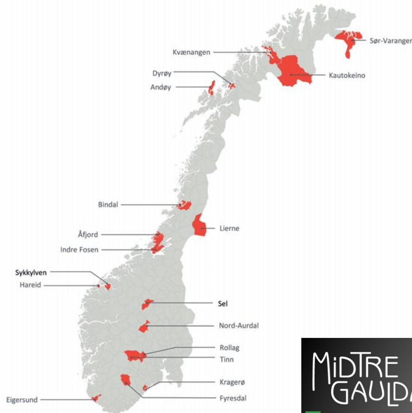
Kart over omstillingskommuner 2020